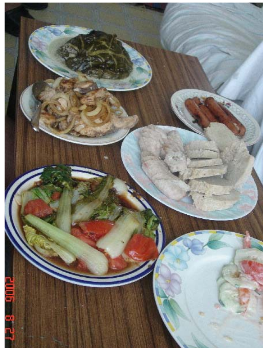
Lunsjmat i Tongastil.