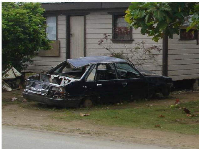
Bilene på Tonga ble gjerne brukt i det lengste.

Det viktigste seilet på en båt som vår, er genoan. Vi flerret vår like før vi kom til Tonga. Vi hadde en til, men den var gammel og reparert flere ganger og ikke til å stole på. Vi måtte ha nytt. Det er vel tre uker siden jeg sporet opp et brukbart tilbud fra Titan Sails i Opuia i New Zealand. Seilet ble omgående sendt med fly til Nuku'alofa. Tida gikk men jeg hørte ingen ting. De hadde både telefonnummer til meg og adresse på Waterfront Café & Lodge, men det var ikke et pip. Mandag 28. ringte jeg fraktselskapet. Nei de visste ikke om noe. Men det måtte bare være der, for i følge Titan Sails, gikk det med fly allerede for 13 dager siden. Vi troppet opp. Mannen på kontoret rotet i noen papirer, men nei. Kunne vi få lov til å titte litt ut i lagerlokalet? Jo det var