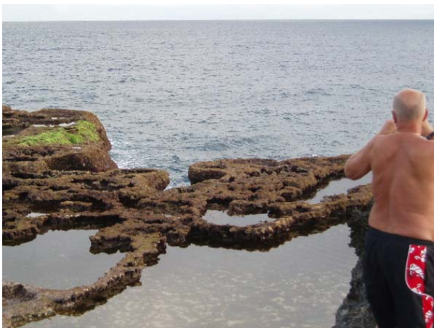
Det ble ikke noen sprut, bare ett tungt sukk nå og da.