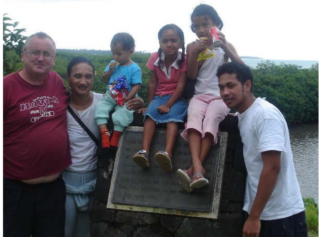
Turgjengen samlet ved Cook-minnesmerket.