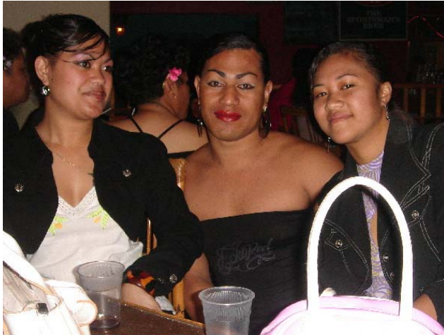
Fra en annen kveld på Davina. Legg merke til vedkommende i midten, nybarbert, sminket og pyntet for anledningen.

Vi skaffet oss en øl hver og fant oss et ledig bord. På dansegulvet var det fullt. Det var betong rett på fast grunn, men likevel gynget det i takt med musikken. Da UB40 kom med min, og Radio Tongas favoritt, I'll be on my way, ble vi dratt opp av stolene og ut på gulvet. Jeg gjorde så godt jeg kunne, men jeg skjemtes nesten der jeg sto og vrei meg mellom gyngende kropper som ventelig var født til rytme og spenstige hoftevriddinger.