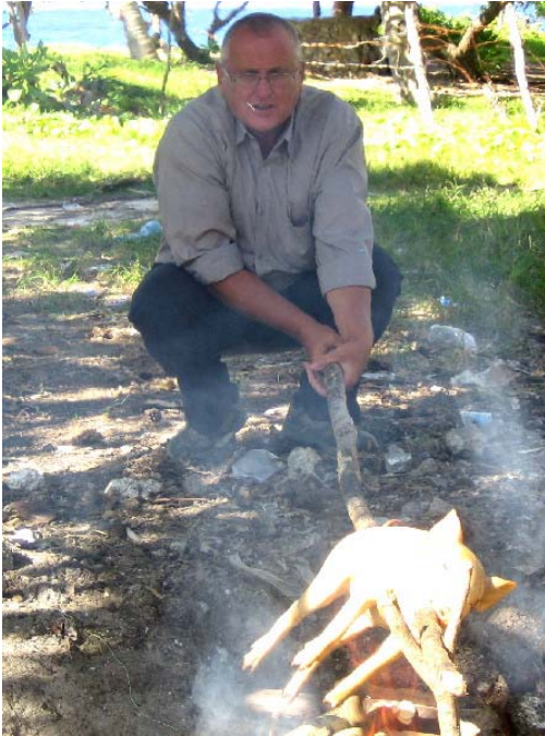
Så var det å stå og sveive i halvannen time