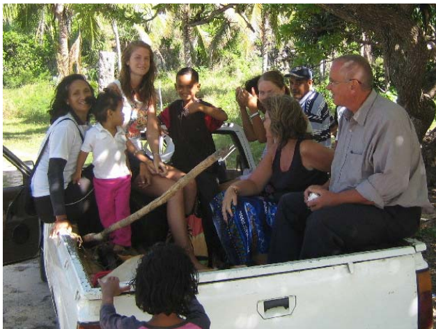
Vi laster opp Datsunen

Tida gikk. Det var gått nesten en time over tida, og vi var innstilt på å gi opp ventingen da en gammel hvit Datsun pickup svingte inn. Seilone satt bakpå planet sammen med minstedatra, svigerinna på 16 og picknikmat og bålved. Ellers var ektemannen, fetteren og to andre av barna med. Maten lå i en plastboks og på toppen lå en nyslaktet smågris. Det var den som skapte forsinkelser eller retttere sagt hanen som egentlig skulle slaktes men som ikke lot seg fange.