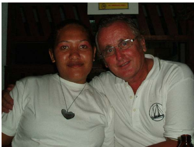
Det var koselig på Billfish