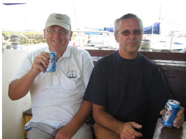
De to siste av ølbeholdningen