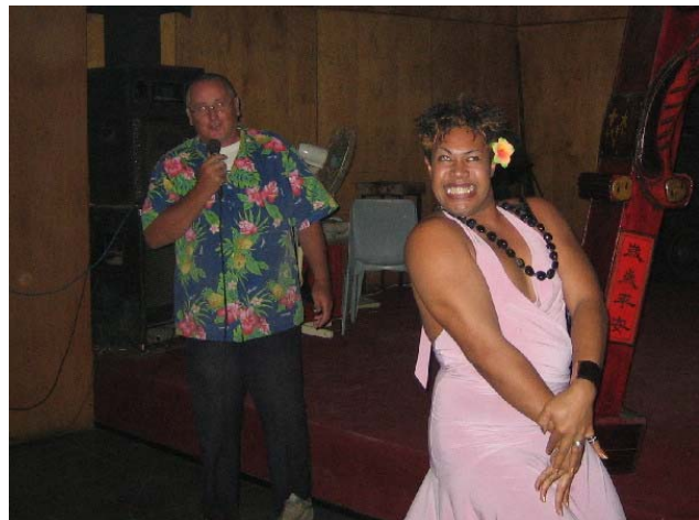
Karaoke på Eurasia med assistanse fra en spontan exhibisjonist