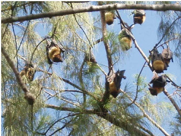
Tongas flygende hunder

Turen gikk først vestover til nordvestspissen av Tongatapu. Her kjørte vi forbi en park med massevis av "fruitbats" også kalt "flying foxes" eller på norsk omtalt som flygende hunder.