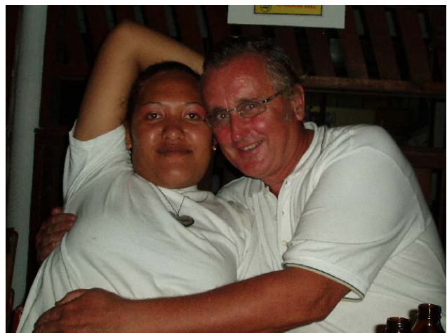
Vi hadde det koselig på Billfish

Jeg begynte å interessere meg for palmene og de saftige kokosnøttene som hang der. For 27 år siden, var jeg ganske flink å klatre i palmer, men nå nyttet det ikke. Jeg var for stiv i lemmene og for