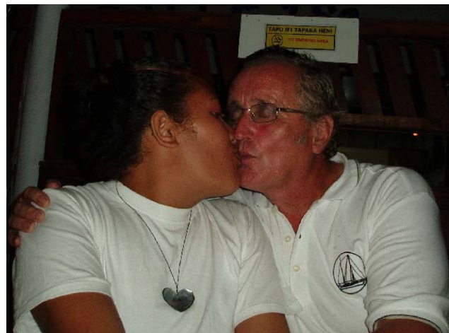
Det var svært så koselig på Billfish

Vi skulle møtes på kaia klokken 11 på mandag formiddag. Hva vi skulle ut på,