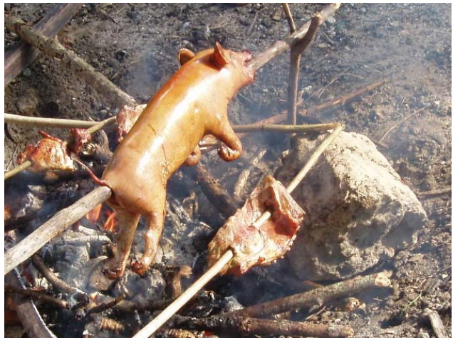
Det begynner å bli farge på svoren

I følge opprinnelige planen skulle vi seile til Fiji og videre til Norfolk Island og Sydney, men vi har innsett at ruta blir for stram. Vi vil heller dra til Aukland og selge båten der. Det tar gjerne sin tid det også. Men årstiden er ikke den rette. Å