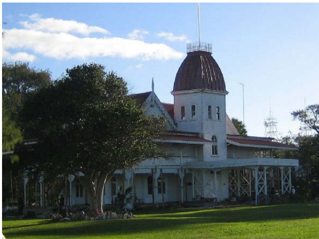
Ha'amonga 'a Maui og Bård

Vi rakk enda en biltur dagen etter og fikk med oss flere severdigheter før bilen skulle leveres kl 14:00. Det var de gamle terrasseformede gravhaugene i Mu'a og de Dryppsteinsgrotten ved Haveluliku. Den siste hadde vi ikke så stor glede av, for vi hadde ikke med lommelykter.