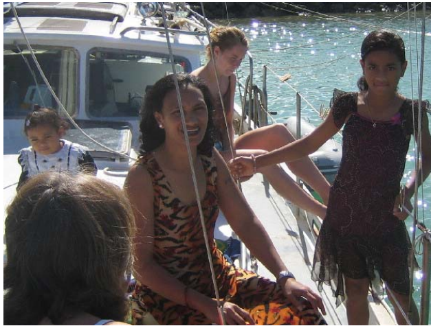
Seiloni på besøk med minstedatra (tv) og storesøster (th)

var vi ikke helt klar over, men det var snakk om å dra til en "beach". Hva slags bil var det de skulle låne for å hente oss i? Vi ville jo bli nokså mange hvis hun skulle ha hele ungeskokken med. Jeg spøkte med at det sikkert var en pickup eller en lastebil, og så skulle vi sitte bak på planet.