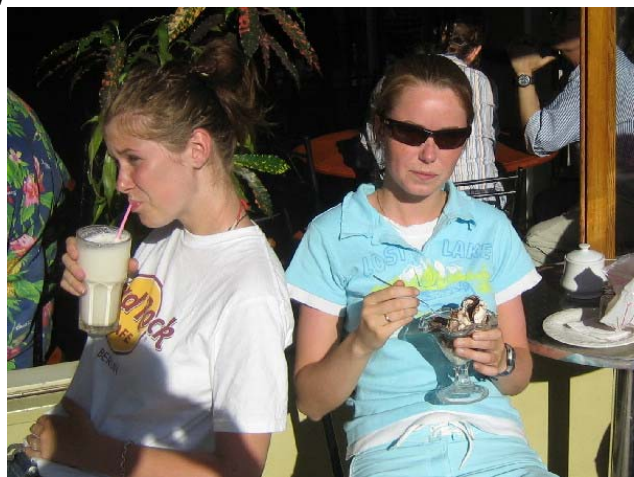
Søstrene Five Sæther koser seg på Friends fortaugsbord

I hovedgata rett rundt hjørnet for Lavmor lå Friends Visitor Bureau og Internet Cafe og Restaurant, et meget populært sted blant de få turistene som var her. Det var trivelig på restauranten med snertne fine og smilende serveringsdamer, men de hadde aldri tid til å prate med oss. Prisene var hakket høyere enn på Lavmor, og så hadde de