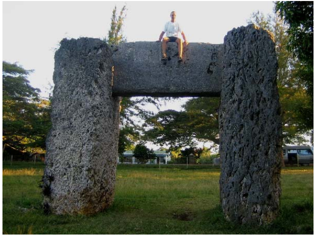
Ha'amonga 'a Maui og Bård

En av de største attraksjonene på Tonga, må vel være Trilitonen eller "Ha'amonga'a Maui" helt på østkysten av Tongatapu. Den antas å være ca 800 år. Det er ganske utrolig at folk på den tiden klarte å bygge slikt som dette av korallblokker hvor bare det synlige over bakken antas å veie over 40 tonn. Man trodde lenge at det var inngangen til kongens residens, og det var det kanskje også, men det var først i 1967 man fant ut at det var et redskap for å bestemme sommer- og vintersolhverv.