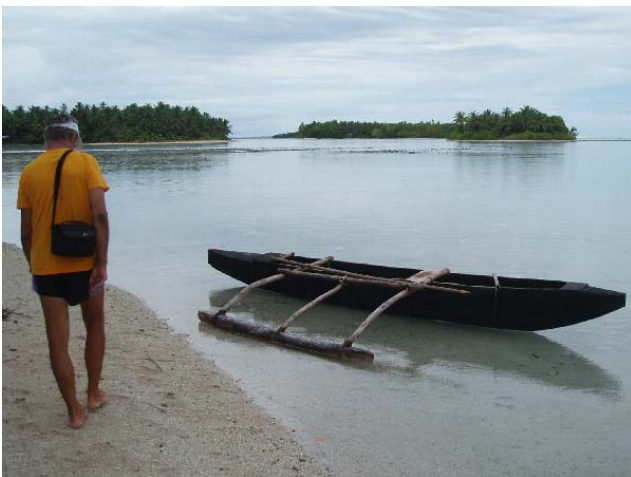
Langs stranda på Savave kunne vi finne en og annen kano av den tradisjonelle typen laget av en uthult trestamme

Andre dagen dro vi relativt tidlig i land. Det var en god del folk inne på land da vi kom. De stelte til "feast" eller etergilde som vi heller burde kalle det på norsk. Bakgrunnen var at en eldre mann døde for 5 dager siden. Dette var innspurten på begravelsesseremoniene. En del kvinner var i ferd med å flette kurver av palmeblad for å bruke til å ha maten på. Ellers hadde de laget en