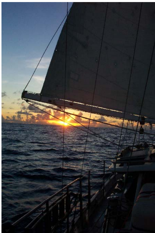
På vei mot solnedgangen

Torsdag, etter at vi hadde fått ny diesel om bord, satte vi kursen for Nukufetau. Utenfor revet heiste vi seil og slukket motoren. Det var dårlig vind rett aktenfra, men vi gjorde 2 – 3 knop. Det nye mannskapet gled godt inn i vaktsystemet vårt med 2-timersvakter.