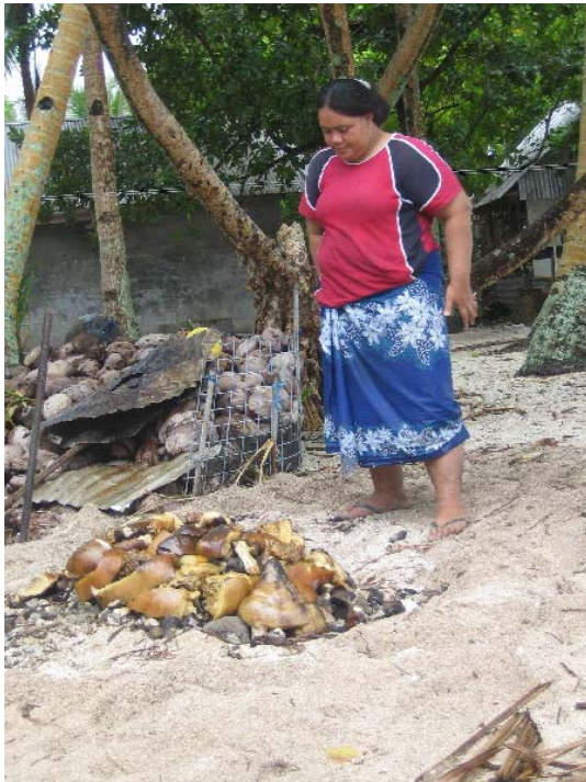
Umu'en med stekt svinekjøtt er åpnet Stella

stekt svinekjøtt. Det var en matoverflod som om de skulle fø en hel millionby. Her, tenkte vi, må det bli litt på oss også. Vi sto nesten å siklet der vi så de stadig bar inn mer mat. Vi dro om bord og spiste en lett lunsj for ikke å ødelegge appetitten.