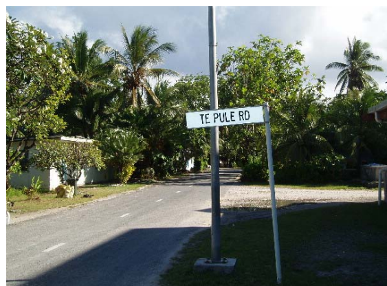
Yndlingsgata vår inn til høyre

Da tiden var inne, dro vi i land og vandret til Ocean Restaurant via Te Pule Road. Dessverre hadde de ikke fått tak i brødfrukt,