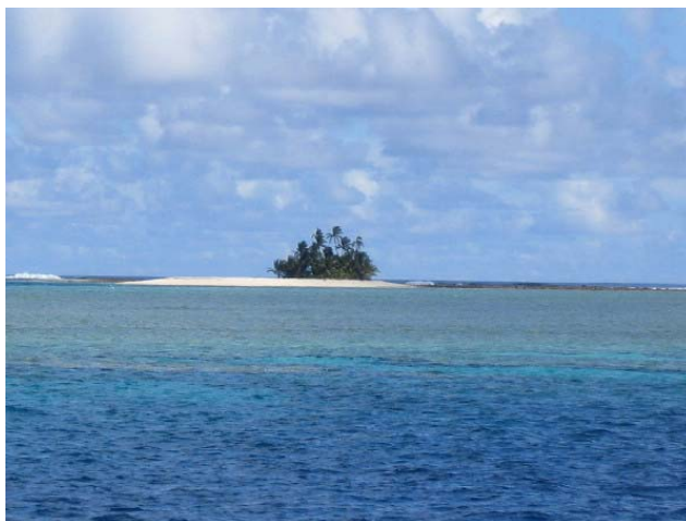
Vi nærmer oss åpningen i revet på Funafuti