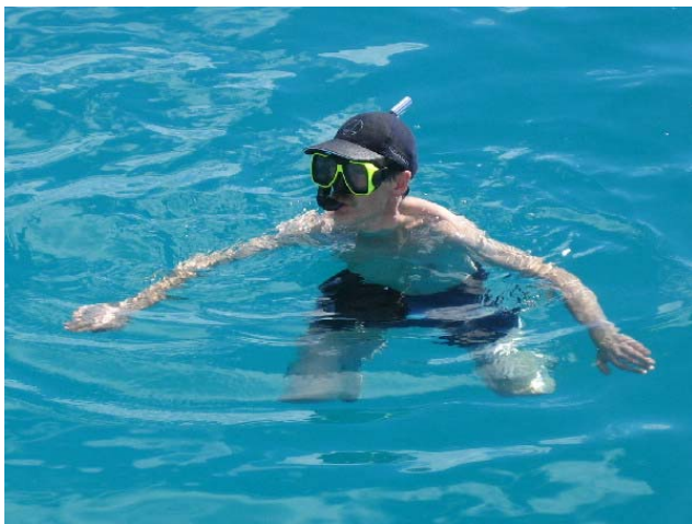
Ivar var rask med å prøve badevann og snorkelutstyr

Om kvelden hadde vi planlagt kombinert velkomst- og avskjeds-party med innslag av lokale spesialiteter. På Ocean Restaurant hadde vi ordnet spesialbestilling på