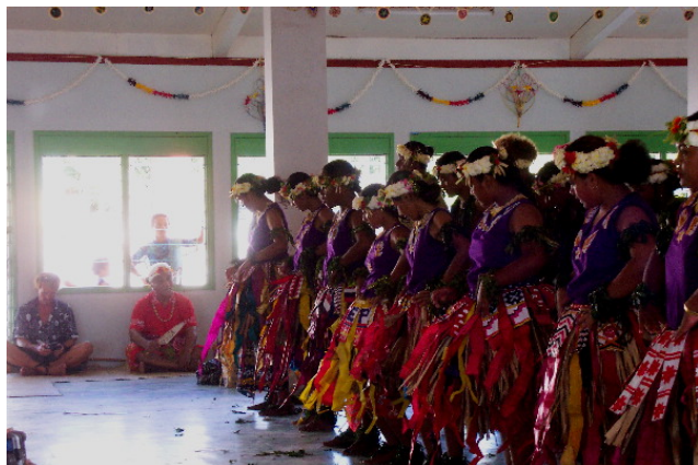
Dansen i maneapaen

Det hele var allerede i gang da vi kom til maneapaen. Det var et fargerikt syn. Det var to grupper kledd i fargerike kostymer som delte hver sin halvdel av maneapaen. Fremst i hver gruppe var det tre rekker, to med kvinner og en med menn, som danset mens resten satt på gulvet og sang av full hals og noen som trommet. Midt i sto dirigenten. De to lagene skiftet om å opptre. Det var ikke mange tilskuere. De som var, satt langs ene langveggen. Jeg sto ved inngangen midt på langsida med videokamera. Etter hvert fant jeg ut at melodien de sang var den samme. Teksten var nok forskjellig, men det var ikke godt for meg å høre.