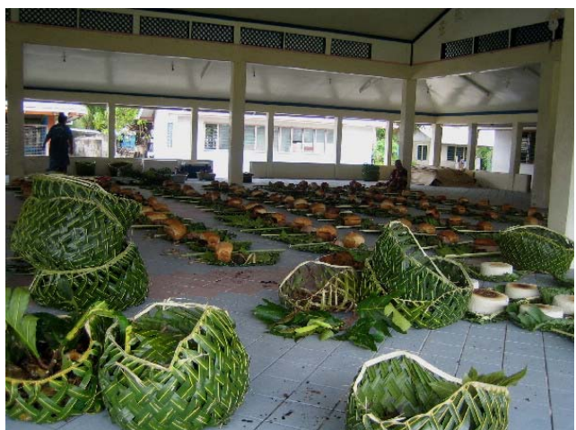
Litt av overfloden i maneapaen

stekt svinekjøtt. Det var en matoverflod som om de skulle fø en hel millionby. Her, tenkte vi, må det bli litt på oss også. Vi sto nesten å siklet der vi så de stadig bar inn mer mat. Vi dro om bord og spiste en lett lunsj for ikke å ødelegge appetitten.