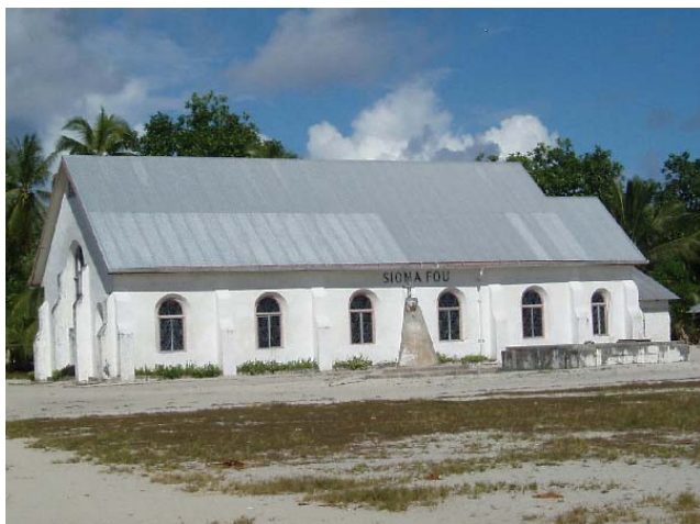
Kirken på Nukufetau

Landsbyen her hadde et helt eget særpreg. Det var et regulært rutenett av stier. På hver firkant sto et bolighus murt opp av betongstein og med bølgeblekketak. Rundt om var det kokospalmer, pandanus og brødfrukttrær. Det var stort sett ganske velstelt. Det var en sti som var bredere enn de andre, faktisk stor nok til at eneste bilen på øya, en liten lastebil, kunne kjøre der. Det var liksom hovedgata. Vi fulgte den og kom forbi telefonsentralen, banken, skolen og sykestua etter tur. Det var ikke store etableringer. Sykestua hadde to ansatte pleiere hvorav den ene hadde permisjon. Den store kirka så nesten europeisk ut i stilen. Den var sentralt plassert med fotballbanen og tre maneapaer rundt seg.