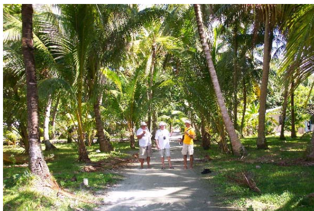
Hovedgata på Savave

Vi måtte søke om løyve i Funafuti til å få dra til Nukufetau. Det ble innvilget, men vi hadde